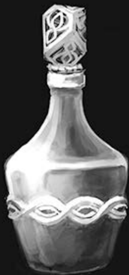
アルゲントウム・ラクリマ 近衛 祐